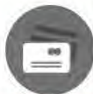
Tarjeta de Crédito