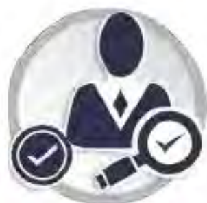
Crédito de Nómina